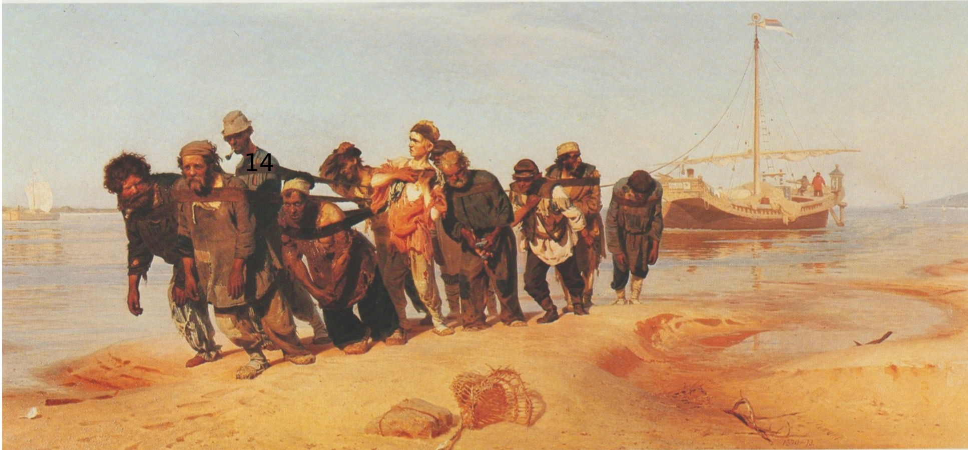
Ilya Repine. Huile sur toile 131.5 x 281 cm