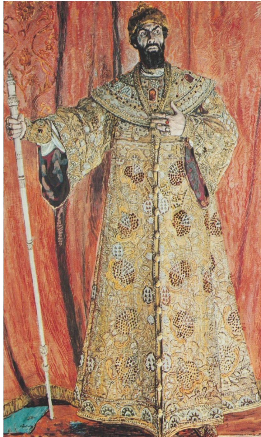
Alexandre Golovin Portrait de F. Chaliapine jouant Boris Godounov 1912