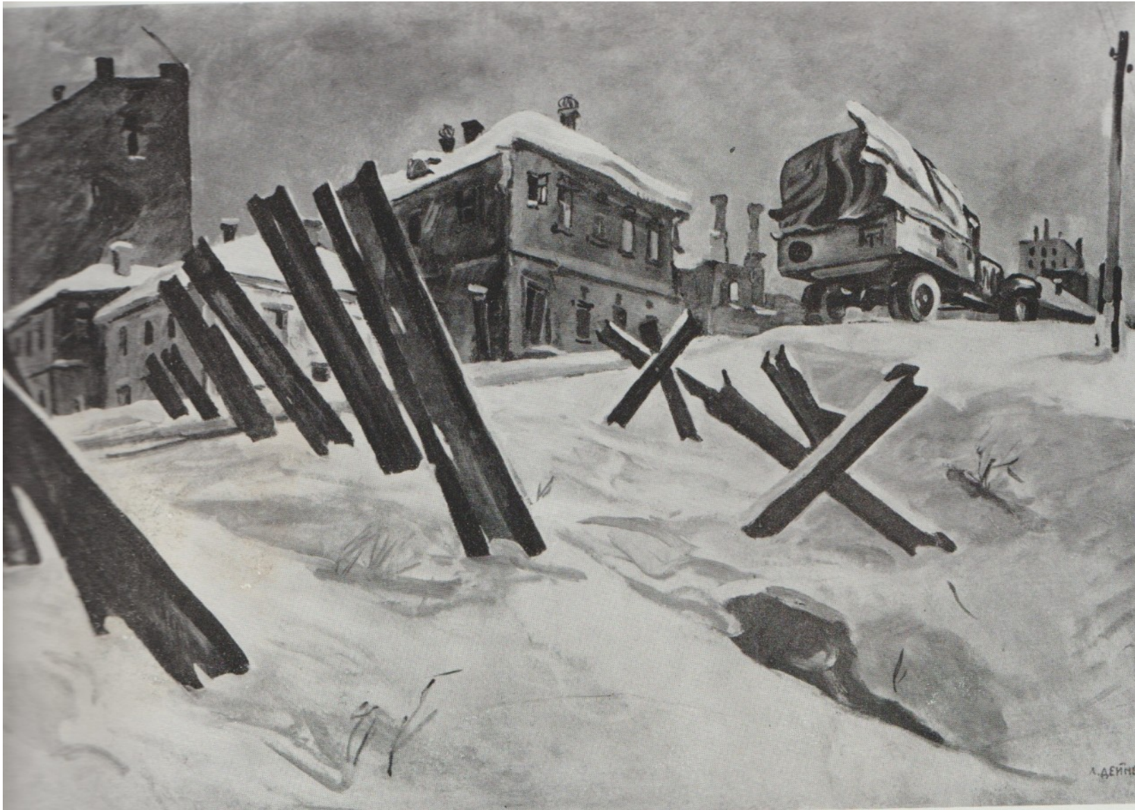
Alexandre Deneika Banlieue de Moscou Novembre 1941 Galerie Trétiakov

Ce tableau évoque un épisode de la défense de Moscou contre les troupes nazies durant la Grande Guerre Patriotique de 1941-45