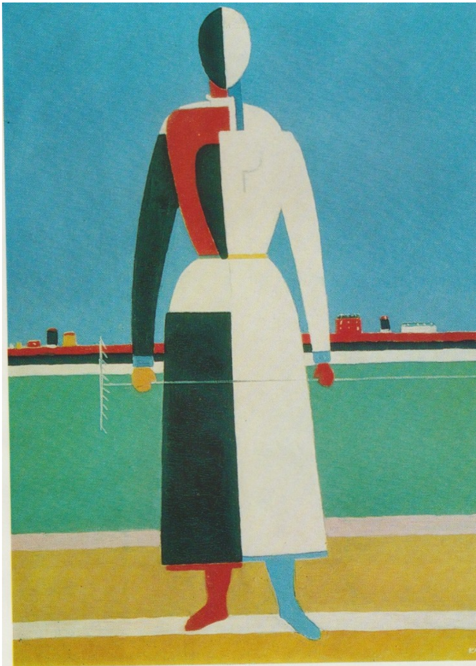
Malevitch Kazimir Severinovitch Femme au râteau 1915