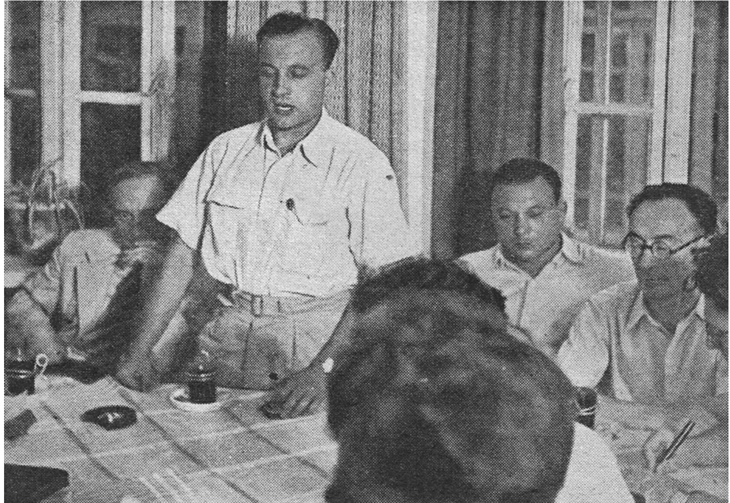
David Frankfurter 1909-1982

Il sera réhabilité par la Confédération dans les années soixante.